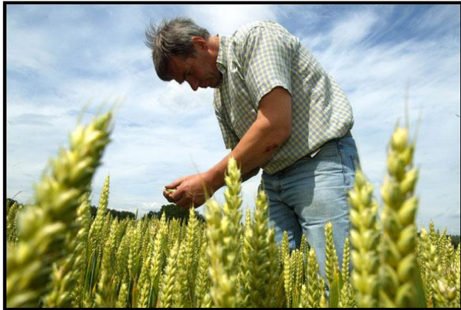
Agricultor Sector primario